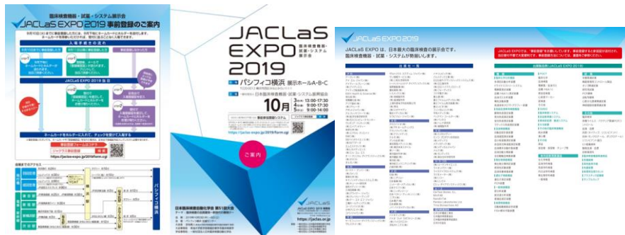
<案内パンフレット>

DM 発送 検査関連学校 (95 施設)、100 床以上の病院 (3,087 施設)