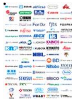
<会員企業ロゴポスター>