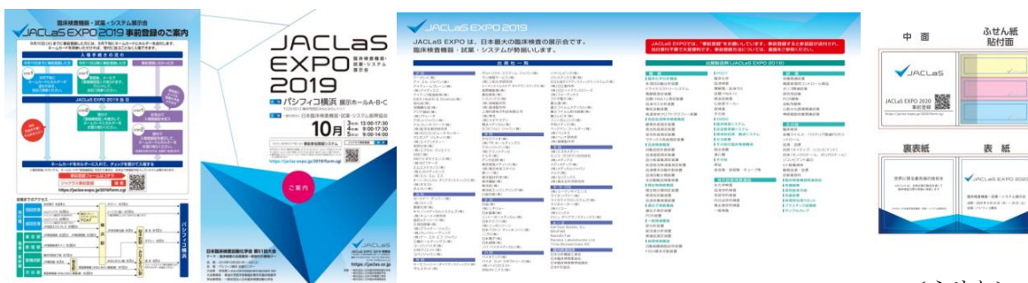
<案内パンフレット>